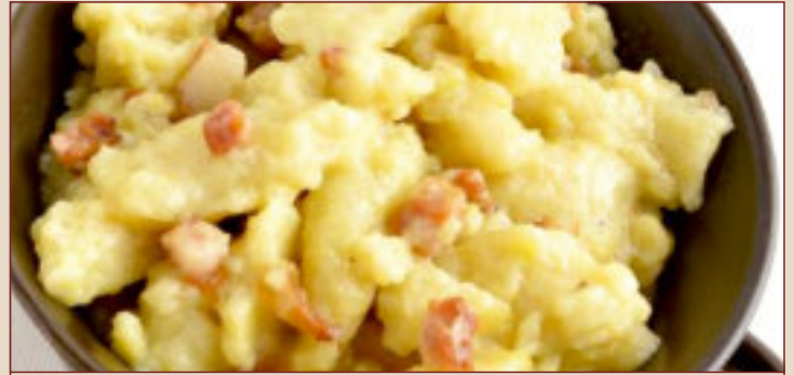
SZARE KLUSKI (1kg, 500g)