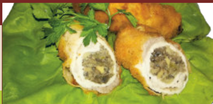
KOTLET PYSZNY WIEPRZOWY (1kg)