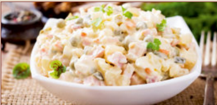
SALAATKA JARZYNOWA (1kg, 500g, 200g)