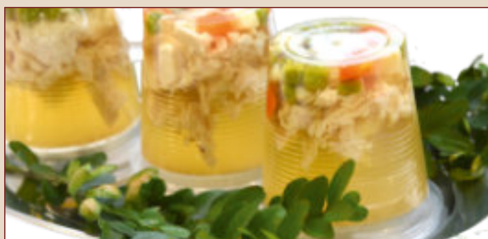
GALART DROBIOWY (130g)