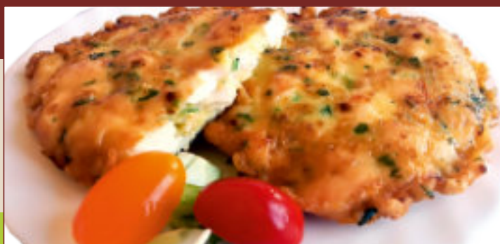
KOTLET WIOSENNY (1kg)