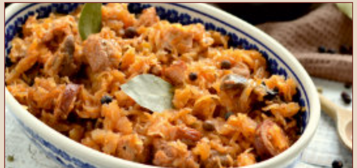
BIGOS (1kg, 500g)