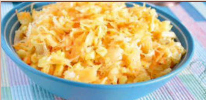
SURÓWKA Z KAPUSTY KISZONEJ (1kg, 300g)