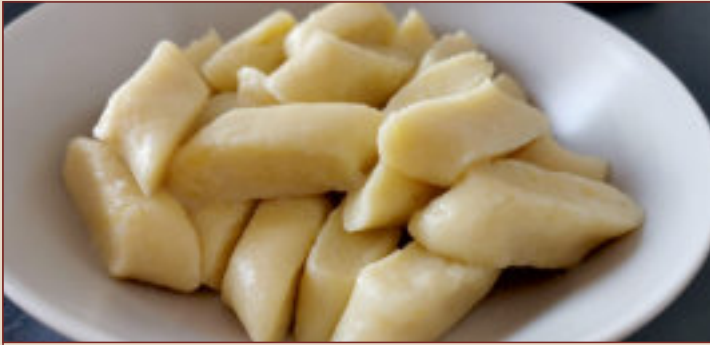
KOPYTKA (1kg, 500g)