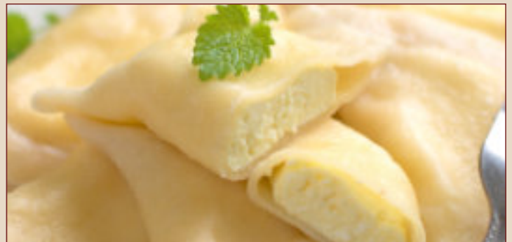
PIEROGI Z SEREM (1kg, 400g)

„SPOŁEM” PSS w GNIEŹNIE ul. ŻNIŃSKA 2 62-200 GNIEZNO www.spolemgniezno.pl tel: 61 424 56 37