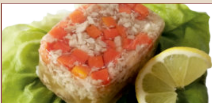
GALART WIEPRZOWY (200g)