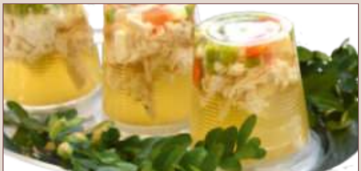
GALART DROBIOWY (130g)