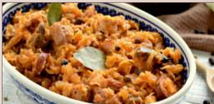
BIGOS (1kg , 500g)