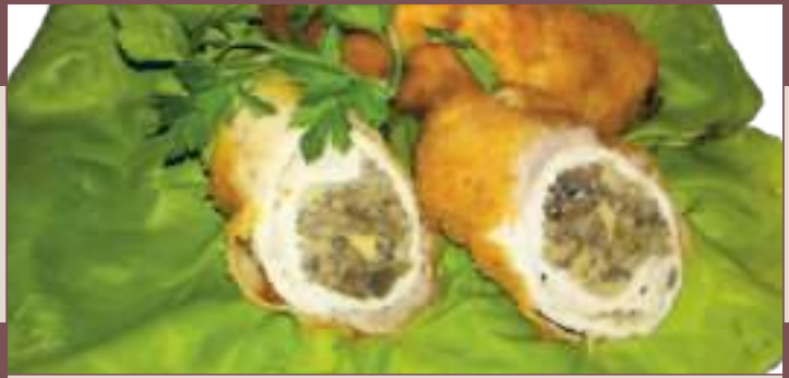
KOTLET PYSZNY WIEPRZOWY (1kg)