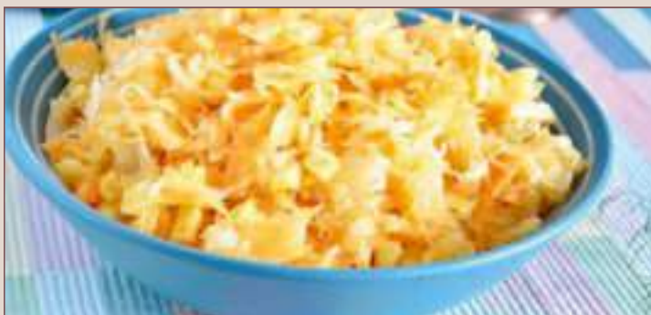
SURÓWKA Z KAPUSTY KISZONEJ (1kg, 300g)