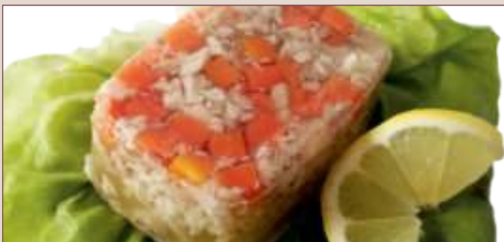
GALART WIEPRZOWY (200g)