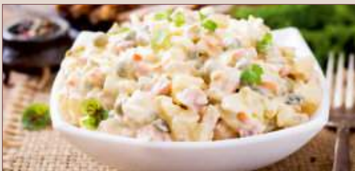
SALATKA JARZYNOWA (1kg, 500g, 200g)