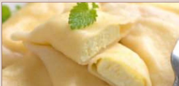
PIEROGI Z SEREM (1kg, 400g)

„SPOŁEM” PSS w GNIEŹNIE ul. ŻNIŃSKA 2 62-200 GNIEZNO www.spolemgniezno.pl tel: 61 424 56 37