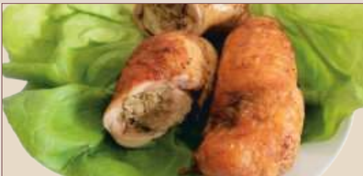
UDKO Z KURCZAKA FASZEROWANE (1kg)