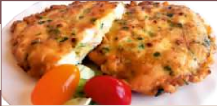
KOTLET WIOSENNY (1kg)