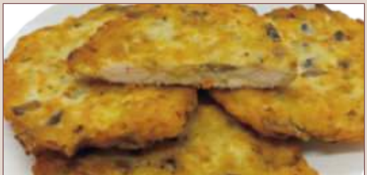
KOTLET Z PIECZARKAMI (1kg)