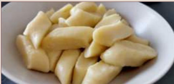
KOPYTKA (1kg, 500g)