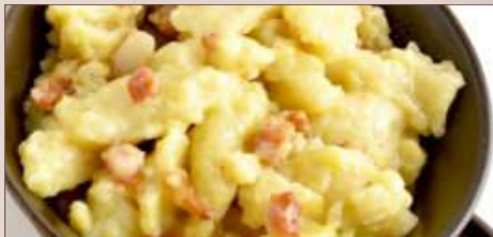
SZARE KLUSKI (1kg, 500g)