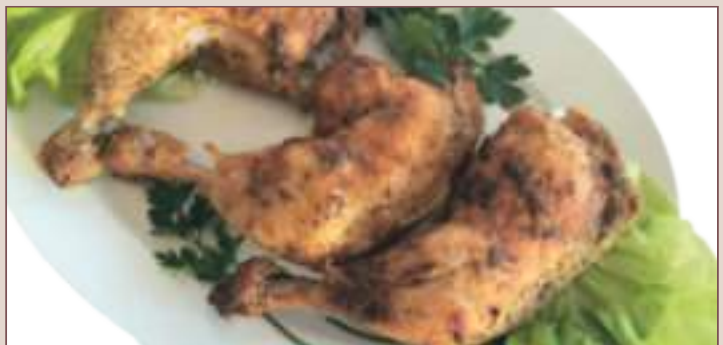
UDKO Z KURCZAKA PIECZONE (1kg)